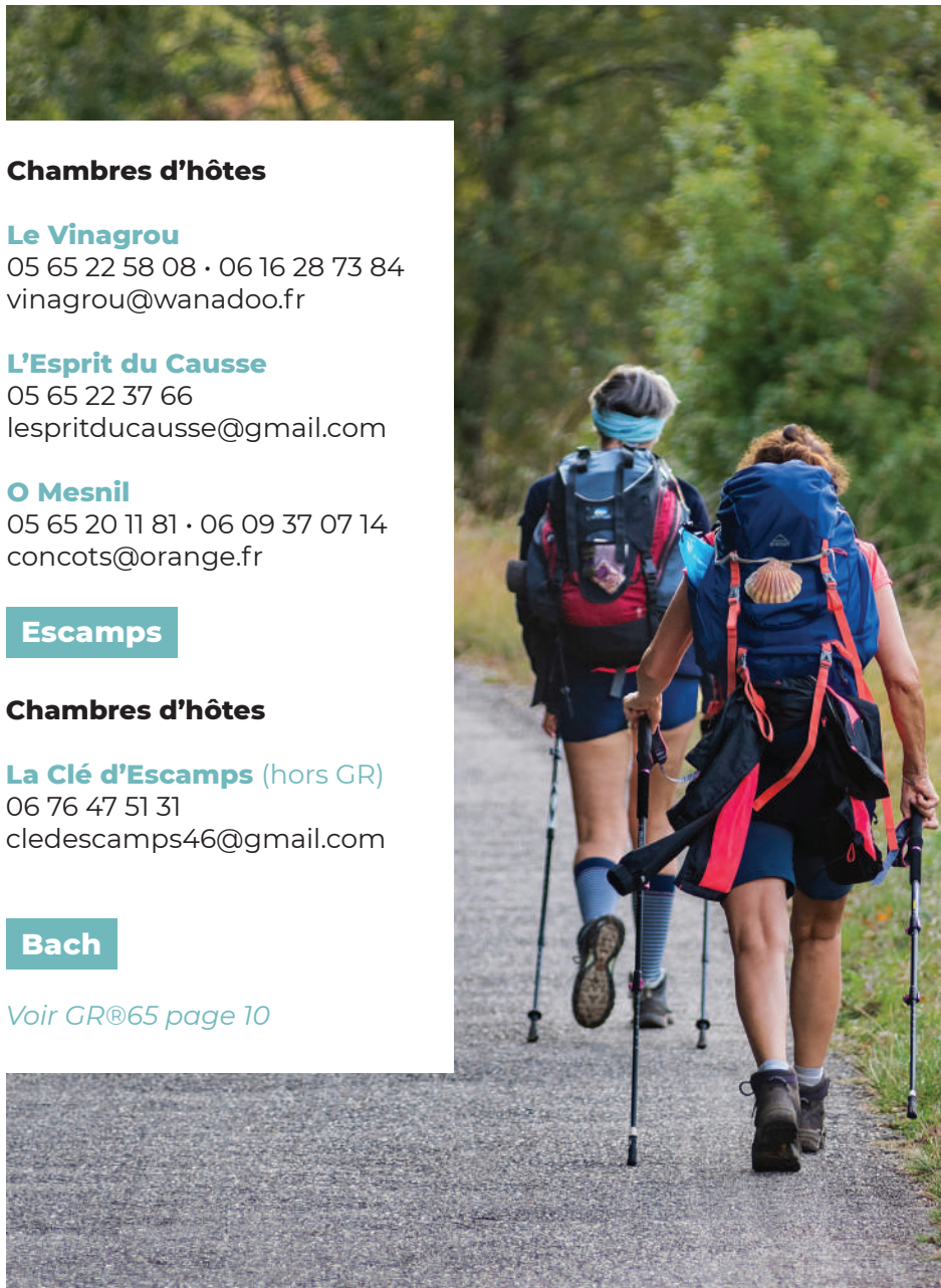
Sur le chemin de Saint-Jacques