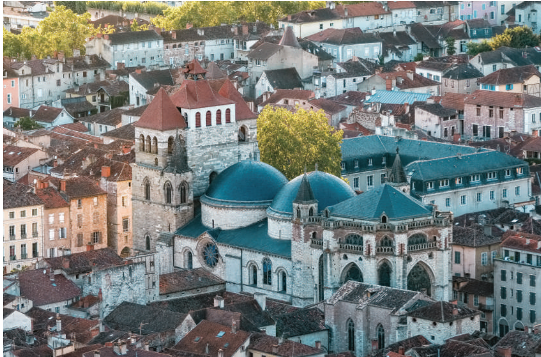
Cathédrale Saint-Etienne - Cahors

Village étape sur le GR°65, les hébergements à l'attention des pèlerins sont nombreux et variés. Piscine, bureau de Poste, distributeur bancaire, services de santé sont disponibles sur place.