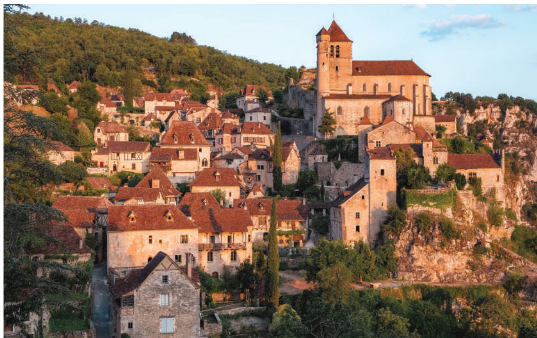
Saint-Cirq Lapopie